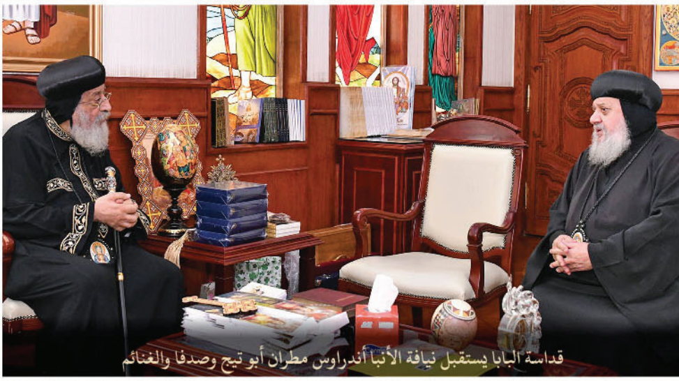
قداسة البابا يستقبل نيافة الأنبا أندراوس مطران أبو تيج وصدفا والغنائم