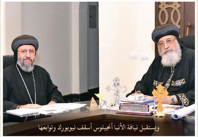
ويستقبل نيافة الأنبا أجيلوس أسقف نيويورك وتوابعها