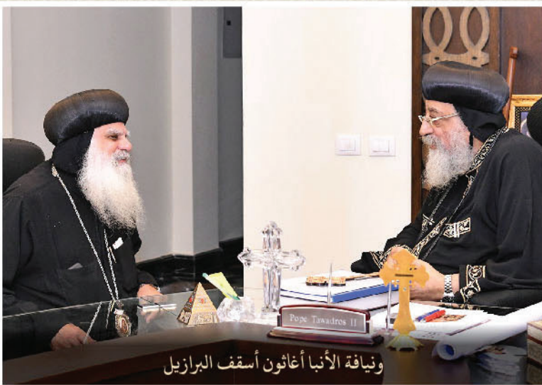
ونيافة الأنبا أغاثون أسقف البرازيل