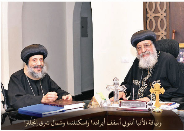
ونيافة الأنبا أنتوني أسقف أيرلندا واسكتلندا وشمال شرق إنجلترا