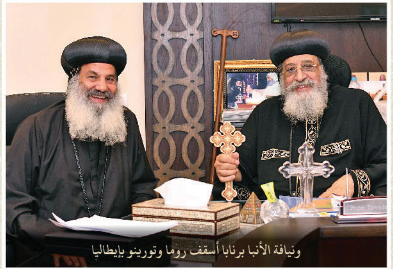
ونيافة الأنبا برنابا أسقف روما وتورينو بإيطاليا