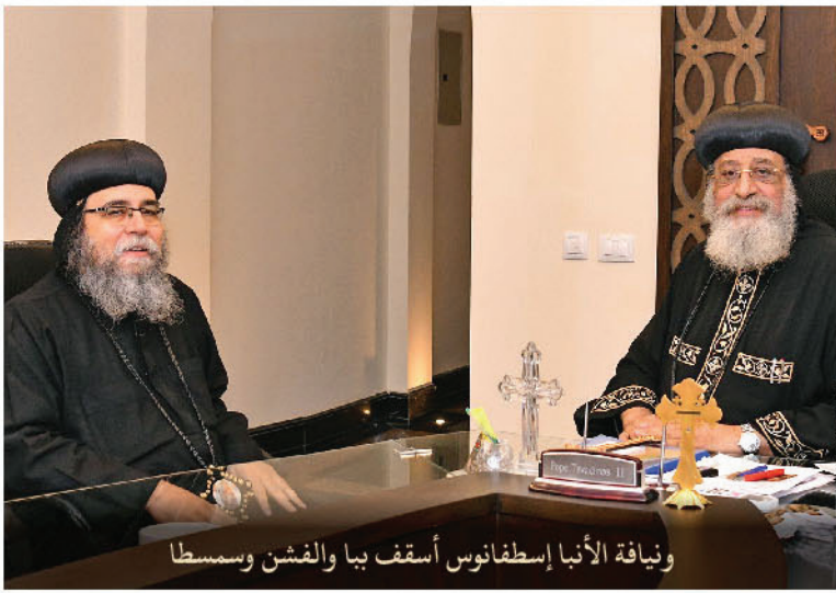
ونيافة الأنبا إسطفانوس أسقف بيا والقشن وسمسطا